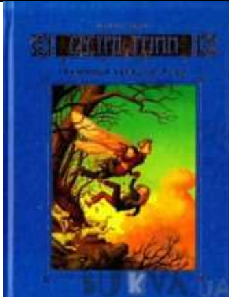
Майкл Баклі «Сестри Грім. Таємниця червоної руки»

Літературно – художнє видання для дітей дошкільного та молодшого шкільного віку