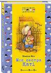
МОНІКА ФЕТ "МОЯ СЕСТРА КАТІ"

Третя книжка з нової серії «Обережно: дівчатка!». Колись автор придумала Капітошку і Петрика П'яточкіна – і вони стали кумирами дітей. Зараз вона розповідає про Оленку, яка жила собі у звичайній квартирі, зі звичайними батьками і звичайним плюшевим ведмедиком Борчиком. Але чомусь усе це надзвичайно цікаво!