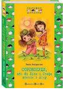
Книга "Сорокопуди, або Як Ліза і Стефа втекли з дому" - Иван Андрусяк

Книга "Сорокопуди, або Як Ліза і Стефа втекли з дому" - Иван Андрусяк. Принято считать, что девочки существа более послушные и покладистые, чем мальчишки. Но только не сестрички Лиза и Стефа – они могут задать фору любому сорванцу! К примеру, им ничего не стоит сбежать из дому, даже если это дом любимой бабушки, которая всю их балует и потчует пирожками. И даже если этот дом в селе, где, казалось бы, приключений и так хватает. Но Лизе и Стефе мало просто приключений – их манят дальние дали. А потому в одну прекрасную ночь девчонки-непоседы решают отправиться в дорогу. . .