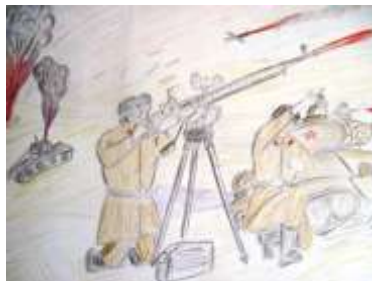
Гуржій Вікторія, 8-А клас