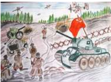
Вареник Наталія, 9-А клас