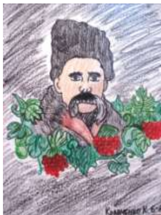
“Т.Г.Шевченко”. Робота Кравченко Катерини (6-А кл.)